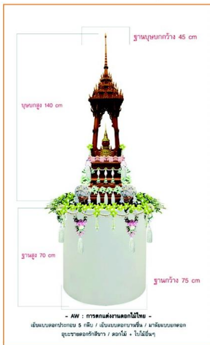
บุษบกที่ทางเพลลาเพลินออกแบบไว้ในห้องรับรอง