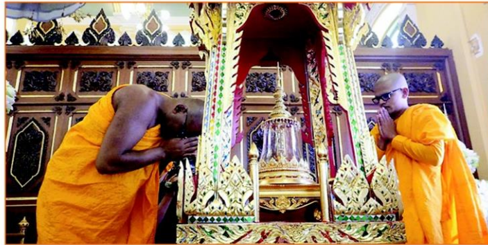
พระสงฆ์จากศรีลังกากราบสักการะพระบรมเกศาธาตุที่ประดิษฐานแล้ว

ศรีลังกา ส่วนวัดอัสสิริยาเป็นสถานที่ถวายเพลิงสรีระสังขารพระอุบาลีเถระ ทั้ง 2 วัดนี้ยังทำหน้าที่สำคัญในการดูแลวัดพระเขี้ยวแก้วอีกด้วย พระบรมเกศาธาตุนี้เป็นองค์ที่ไม่เคยอัญเชิญมาในประเทศไทยมาก่อน จึงเป็นครั้งแรกในรอบ 700 ปีที่พุทธศาสนิกชนชาวไทยจะได้มีโอกาสเข้ากราบสักการะพระบรมเกศาธาตุและพระบรมสารีริกธาตุที่อัญเชิญมาพร้อมกันในครั้งนี้เพื่อเป็นสิริมงคลแก่ชีวิต