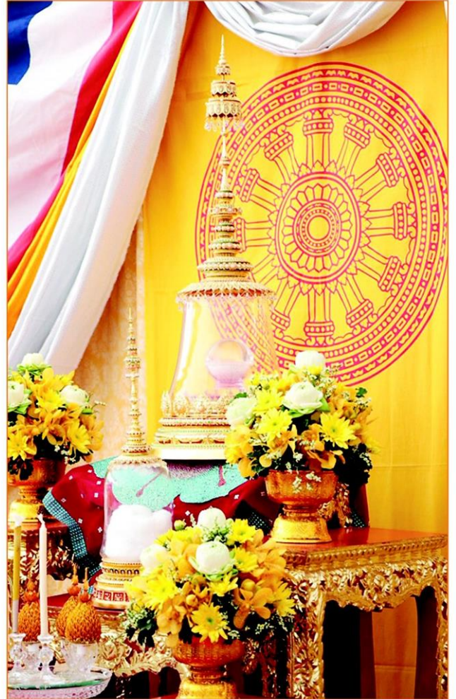
พระบรมเกศาธาตุและพระบรมสารีริกธาตุที่ประดิษฐาน ณ พระตำหนักเพชร วัดบวรฯ

เดิมพระบรมเกศาธาตุเก็บรักษาอยู่ที่วัดโบราณแห่งหนึ่งในเมืองแคนตี ประเทศศรีลังกา และเป็นที่เคารพบูชาอย่างสูงสุดมากกว่า 700 ปี จนกระทั่งเมื่อประมาณ 3 ปีก่อนจึงได้อัญเชิญมาประดิษฐานที่ Nelligala International Buddhist Center เพื่อให้พุทธศาสนิกชนเดินทางมาสักการะได้สะดวกขึ้น และการอัญเชิญมายังประเทศไทยในครั้งนี้เป็นดำริของพระสังฆนายกแห่งวัดมัลลวะวัดตะมหารวิหาร หรือวัดบุปผาราม และพระสังฆนายกแห่งวัดอัลศิรียมวิหาร ประเทศศรีลังกา โดยวัดมัลลวะวัดตะมหารวิหารที่พระอุบาลีเถระ และคณะสมณทูตจากกรุงศรีอยุธยาทำการบรรพชาอุปสมบทให้ชาว