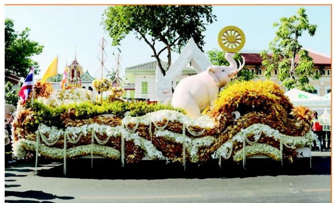
รถดอกไม้